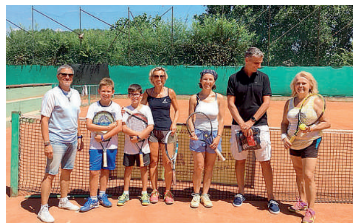
Un momento della manifestazione